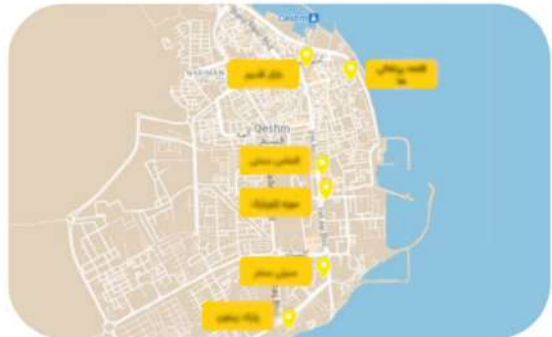
لینک این مسیر رو داشته

اگر نوبت شهر قشم اقامت دارید، این لوکیشن ها براتون کاربردیست.